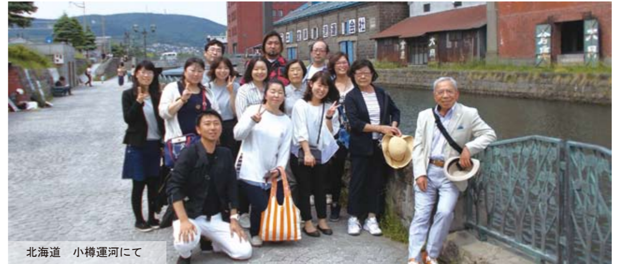
北海道 小樽運河にて