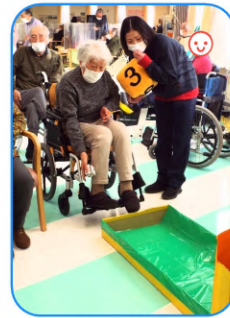
すごろく(サイコロを投げます)