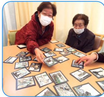
皆さんさすが！早いです