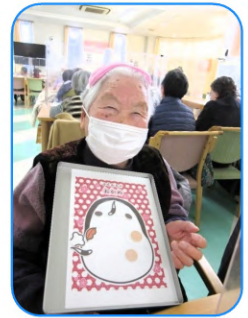
なかなかの出来栄え！