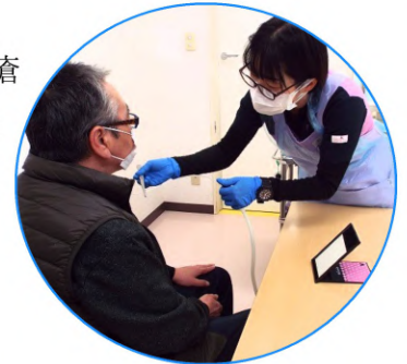
【通所リハビリテーション利用状況】