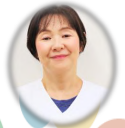
地域連携室長兼外来科長