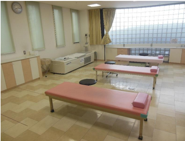
リハビリ・マッサージ室